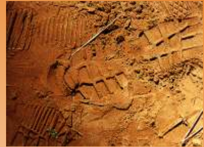
Spuren verraten etwas

2. Menschen, Tiere und Pflanzen und Naturkräfte hinterlassen Spuren!