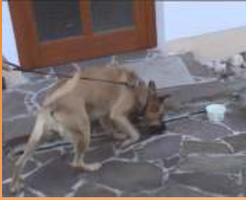
Hund sucht Spuren