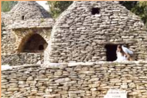
Steinhäuser in Frankreich aus dem 18. Jahrhundert

2. Menschen, Tiere und Pflanzen und Naturkräfte hinterlassen Spuren!