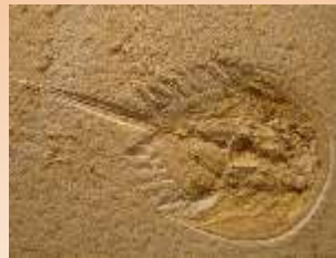
Pfeilschwanz versteinert (=Fossilien)