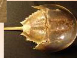
Pfeilschwanz lebt noch heute